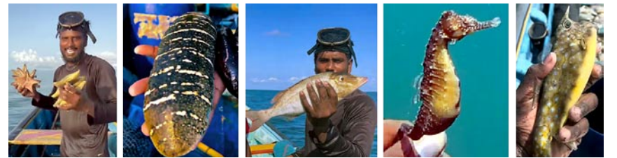
கடல்நட்சத்திரம், கடலட்டை ஓரியா விளைமீன் கொடிவாளை குட்டுறு