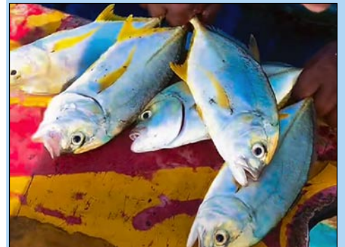
செங்கடாய்ப் பாரை- மஞ்சள்ப் பாரை