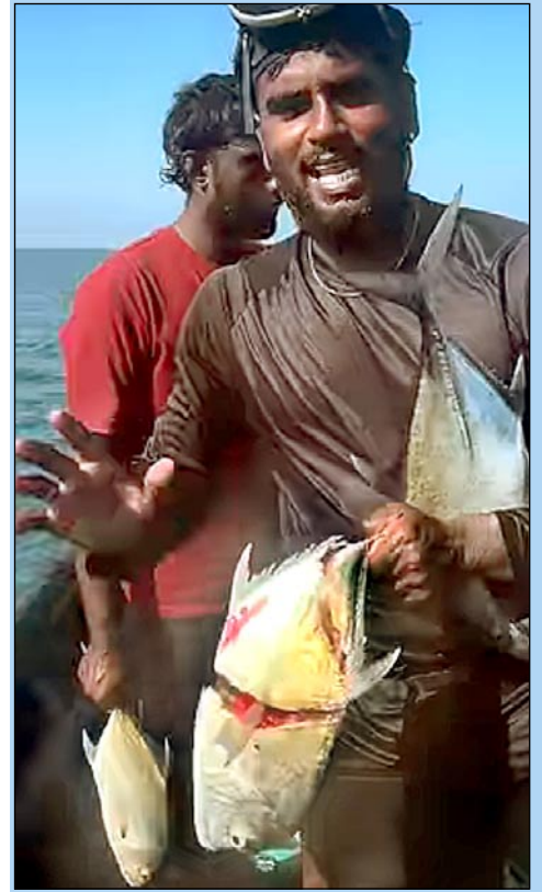
முண்டன் சுறாவின் வேட்டை வாயிலிருந்து படுகாயங்களோடு தப்பித்த இளம் கருங்கண்ணிப் பாரை. (கருக்குவால்ப் பாரை)