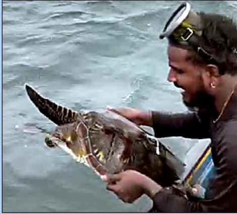
7, 8 வயதுடைய இளம் ஆமையை மீண்டும் கடலுக்குள் விட்டுவிடும் உயிரியல் அக்கறை