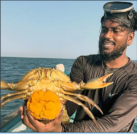
8,10ஆயிரம் ரூபாக்கு விற்கமுடியும் என்றாலும், லட்சக்கணக்கான முட்டைகளை வயிற்றில் தாங்கியிருக்கும் பெருநண்டை மீண்டும் கடலுக்குள் விரும் உயரிய கரிசனை.