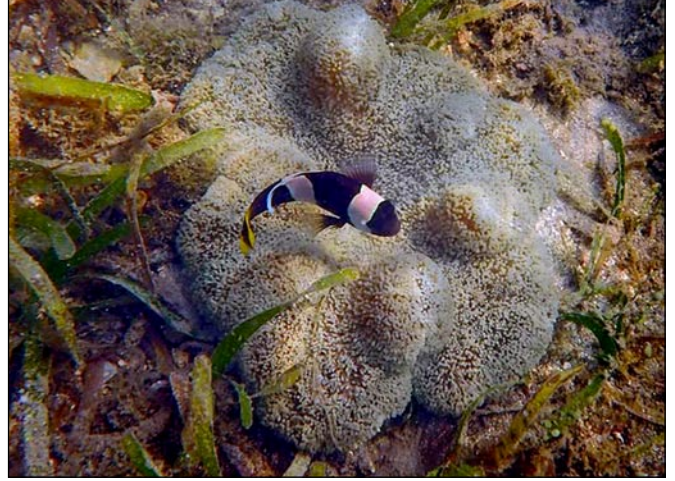
கடந்தாமரை: கடலட்டை, கடற்பாசிப் பண்ணைகளால் அழிந்துபோகும் கடல் உயிர்களில் ஒன்று

வேலைவாய்ப்பு என்ற பெயரில் கொள்ளை இலாபமடிக்க இது நினைக்கின்றதேயொழிய, மக்களின் வறுமையைச் சீராகப் போக்கவோ மக்களுக்கு புரத உணவை பெற்றுக் கொடுக்கிற நல்ல எண்ணங்களிலோ இவர்களுக்கு நாட்டம் கிடையாது. இப்பொழுது கடற்பாசியில் இருந்து “பயோ” எரிபொருளை உருவாக்கலாம் என்பதைக் கண்டறிந்தபோதும் இவ்வண்மையை மக்களுக்குச் சொல்லுவதும் கிடையாது. 50ஆம் ஆண்டிலிருந்து 60 மடங்கு பாசியுற்பத்தியை இத்தொண்டு நிறுவனங்களை வைத்தும் இவர்கள்