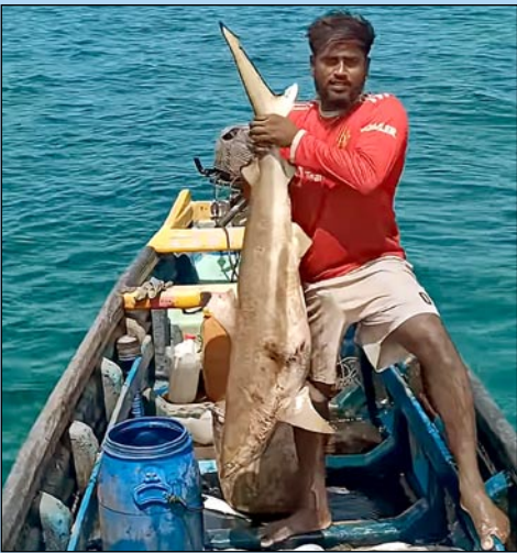
20கிலோவுக்கும் மேற்பட்ட முக்கமான முண்டன் சுறாவை மிக லாவகமாகக் கையாளும் அருணாடைய நுட்பம். இது கடலில் மிகவும் அபாயமானது. முண்டஞ்சுறா, வெள்ளைச் சுறா, பெருவஞ்சுறா (The great white shark) என்ற பெயர்களால் அழைக்கப் படுகிறது.

கடல் என்றால் அவரவர் “சோத்துப் பீங்கானுக்குள்” கயல்மீன் குழம்பும், ஓட்டிப் பொரிச்சமீனும், திரளிச் சொதியும் இருந்தால் போதும், அதற்கு மட்டும்தான் கடல் என்ற கணக்காகவும், கடற்பிரச்சனை என்றால் அது கரையோரத்தில் இருக்கின்ற சில சாதியினருடைய பிரச்சனை மட்டும்தான் என்பது போலவுமே இருந்து வருகிறார்கள். “கடலையும் பனையையும் சாதியாகப் பார்த்துப் பழக்கப்பட்ட யாழ்ப்பாணத்தார்” என எனது பல பதிவுகளில் அழுத்தம் திருத்தமாகச் சொல்லி வந்துள்ளேன். இன்றுவரை உண்மையும் அதுதானே...!