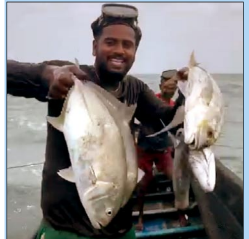
கருக்குவால்ப் பாரை. கருங்கண்ணிப் பாரையின் இளம்பருவம் சுவையானது.