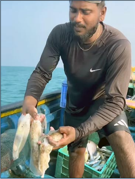
ஓட்டுக் கணவாய், பீல்க் கணவாய்-வித்தியாசங்களும் தன்மைகளும்.