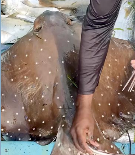
அதிக கவையான பூவாயித் திருக்கையின் அதிக விஷமான முட்கள்