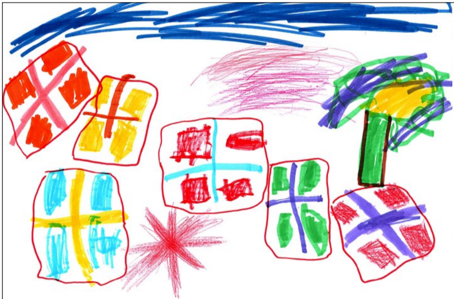
Adelen 5 år.

Vi pynter huset med mange flagg. og spiser is.